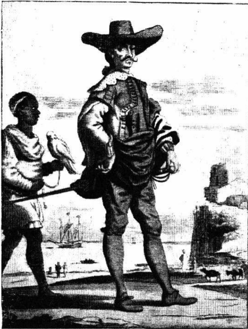
Soldado español de las Antillas. (Siglo XVII.)