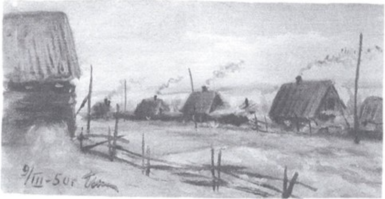
4. Pueblo de Pijtovka, dibujado por Nikolái Bilétov.