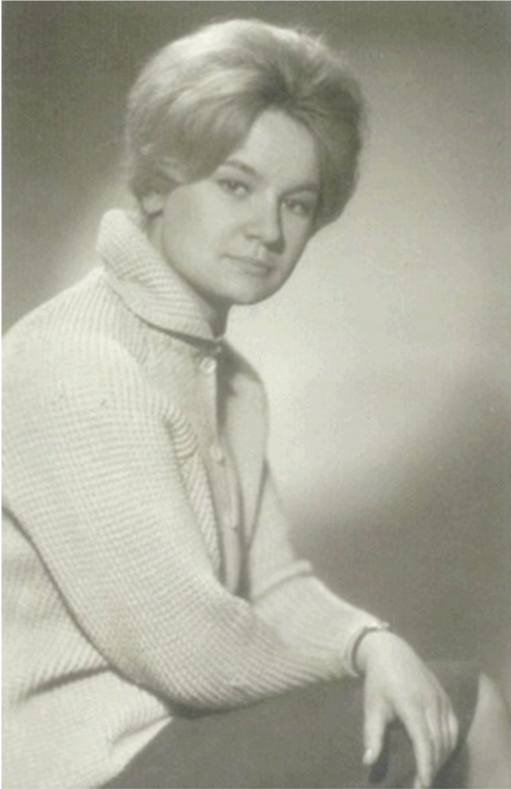
28. Galia universitaria.