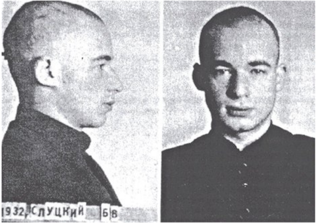
10. Borís Slutski.