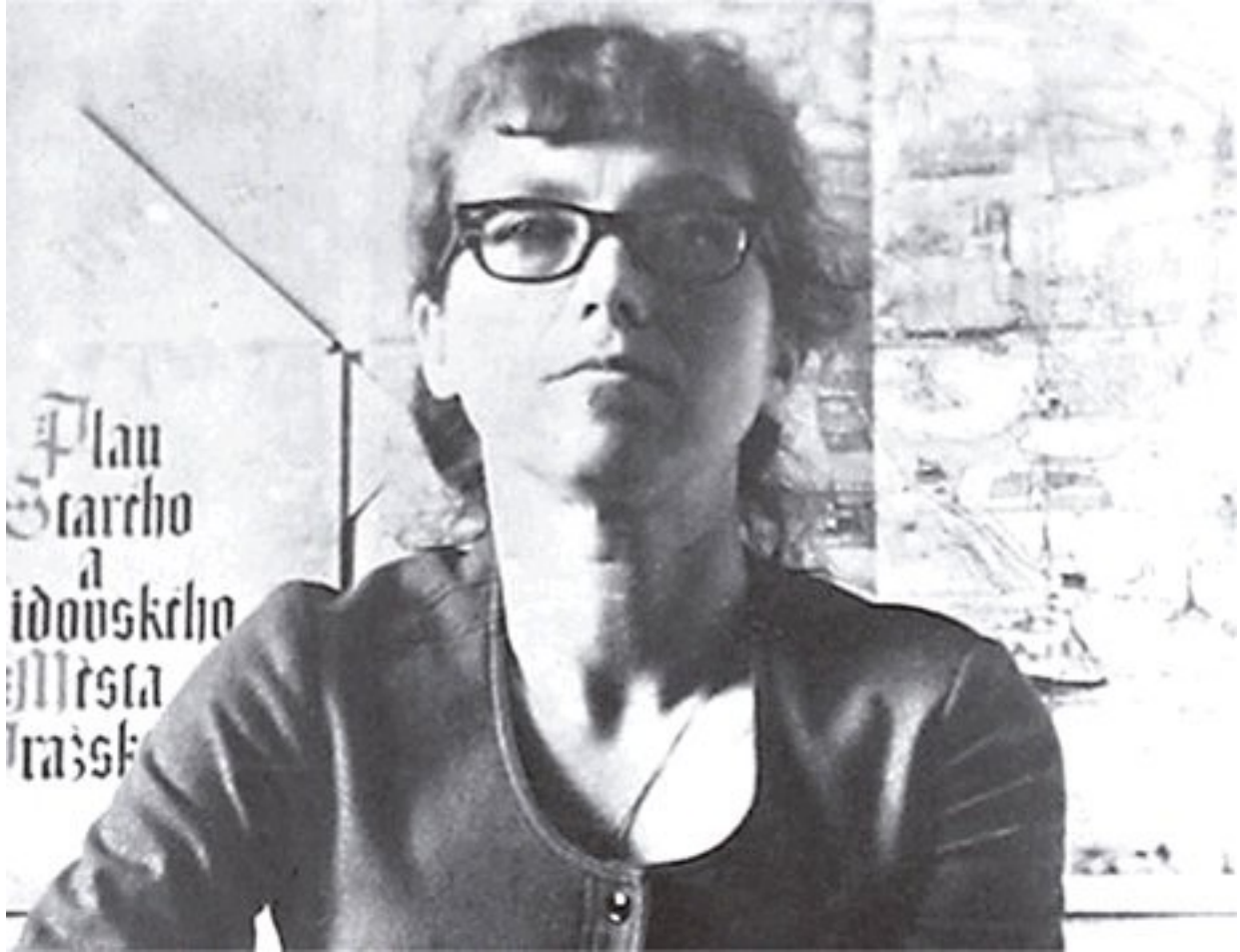
24. Natalia Gorbanévskaya en los años sesenta.