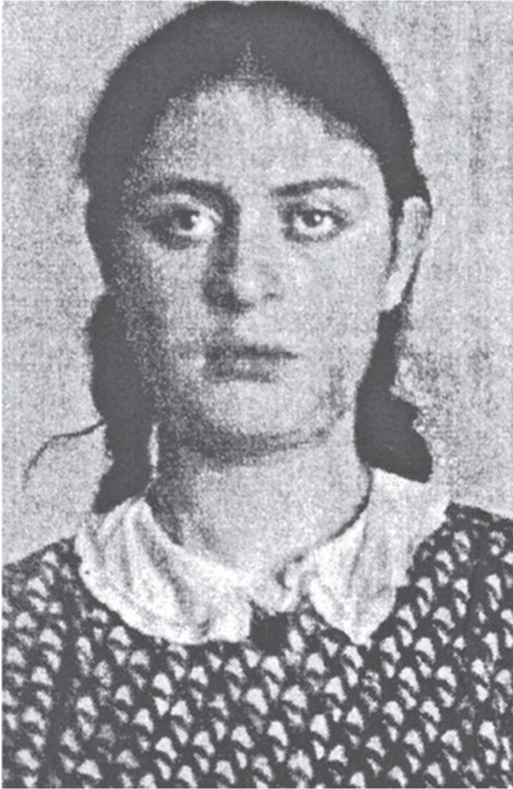
8. «... las reclusas de las celdas colectivas de la prisión