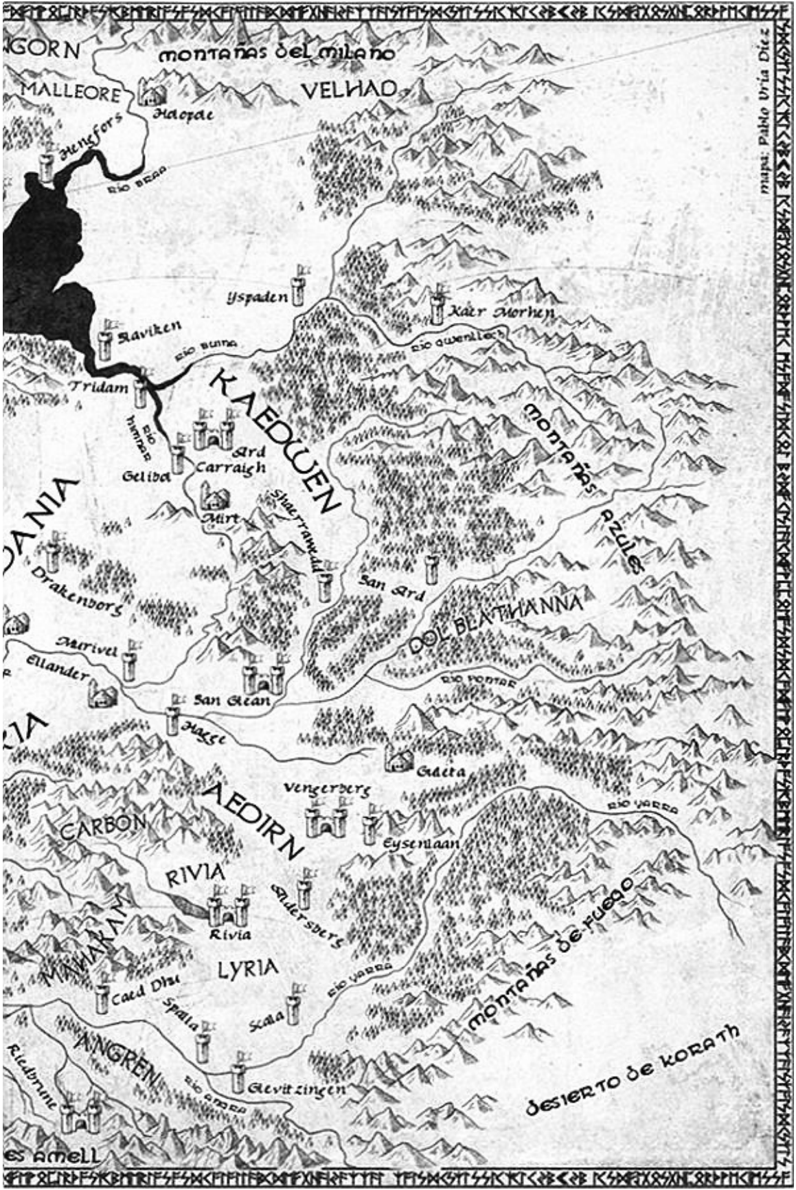
mapa: Pablo Uria Díez