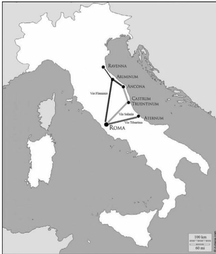
Referencias a las vías romanas de la Península Itálica mencionadas