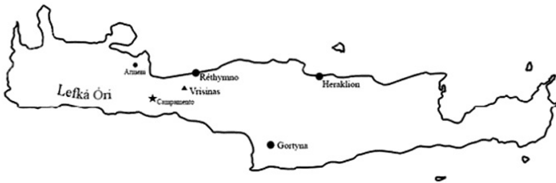
Referencias principales de la isla Creta