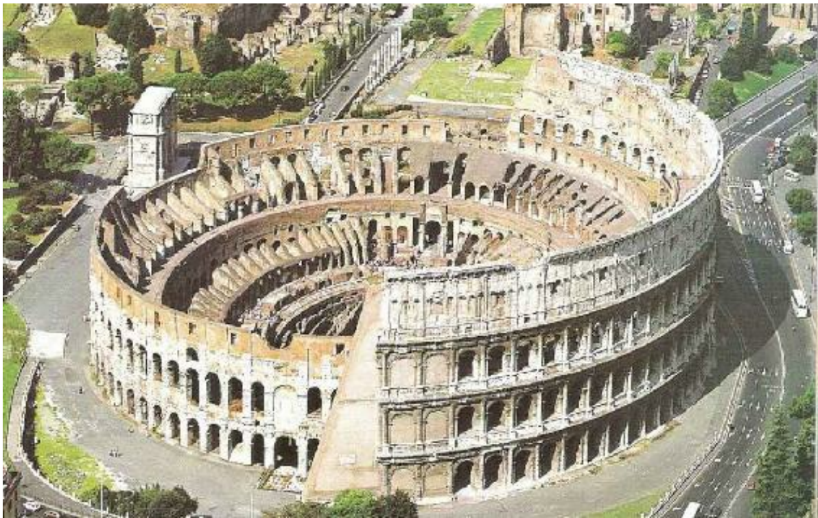
El Coliseo Romano como luce actualmente ...