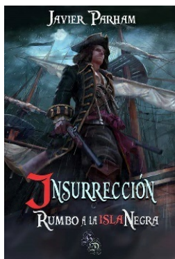
Insurrección ... Rumbo a La Isla Negra Abril 2018