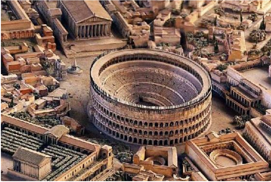
El Coliseo Romano como lucía en su época dorada ...