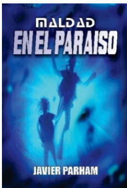
Maldad En El Paraíso Noviembre 2016