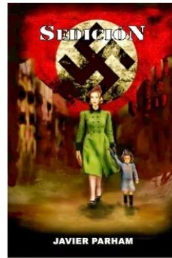
Sedición Junio 2016