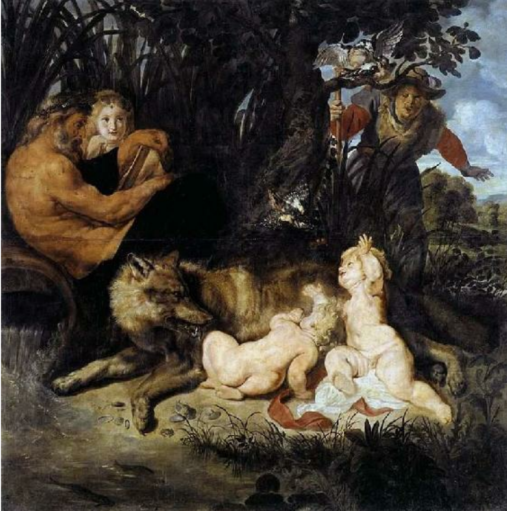
Rómulo y Remo ... Pintura al óleo de Paul Rubens 1615.