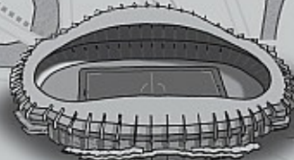
Estadio de Anoeta