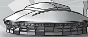
Plaza de toros de Illunbe