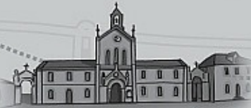
Cementerio de Polloe